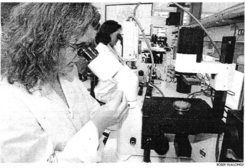
Científicos en el Centro de Medicina Regenerativa de Barcelona

Arropado por los más destacados representantes de la comunidad científica y del mundo empresarial, desde Valentín Fuster, Pedro Duque a Ana Patricia Botín y Florentino Pérez, el presidente del ejecutivo destacó que la política de I+D+i es "el verdadero eje estratégico de la acción del Gobierno". "El esfuerzo de Ingenio 2010 —aseguró Zapatero— nos va a permitir crecer más y mejor. Y hay señales que indican un cambio de tendencia hacia un patrón de crecimiento más productivo y equilibrado". Además, afirmó que "acelerarán" los programas estratégicos de Ingenio 2010: Cénit (mayor colaboración entre centros públicos y empresa privada), Consolider (aumento de la masa crítica in-