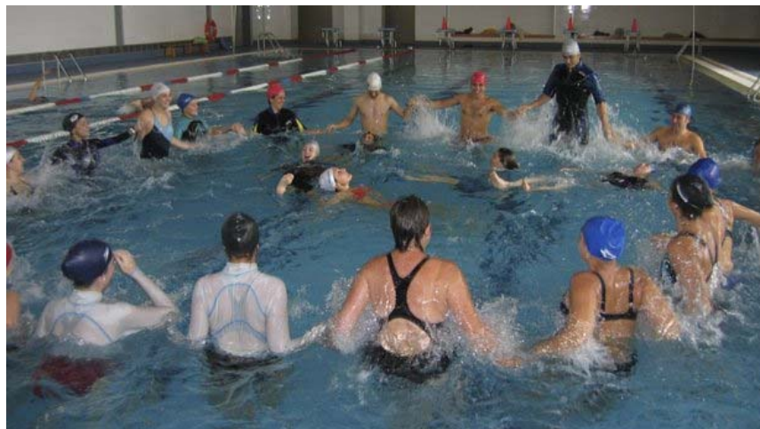
Un grupo de pacientes durante una sesión de fisioterapia acuática.

Muchas son las patologías a las que les puede ser útil la aplicación de esta metodología. Basada en los principios de Hidrostática, Hidrodinámica, Termodinámica y en las reacciones del cuerpo humano inmerso en el agua, la técnica Halliwick amplía cada vez más sus horizontes, permitiendo que sus beneficios se extiendan a múltiples contextos.