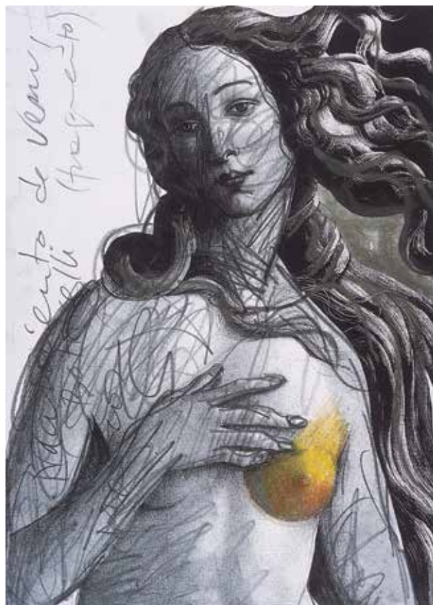
Carmen Marcos / (gAmis)

"Compartir experiències i emocions amb altres companyes m'ha donat la força per superar molts moments i ser positiva en aquest difícil 'parèntesi' de la meua vida"