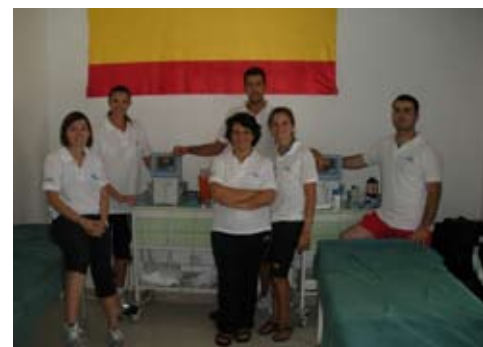
Equipo Médico Fisioterápico Deportivo del C.P. E.