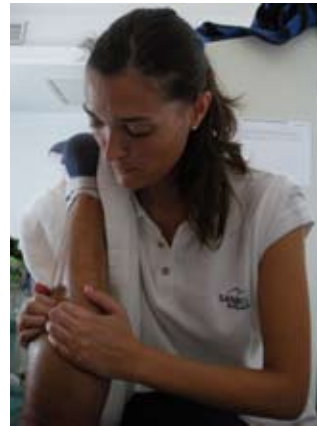
Sesión descarga de gemelos (Triceps Sural).