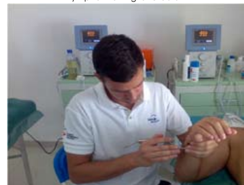
Sesión de ganchos en musculatura flexora