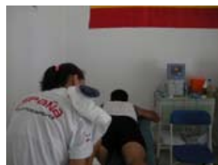
Equipos de Electroterapia-Ultrasonidos-Lóser BTL en las instalaciones del servicio médico.