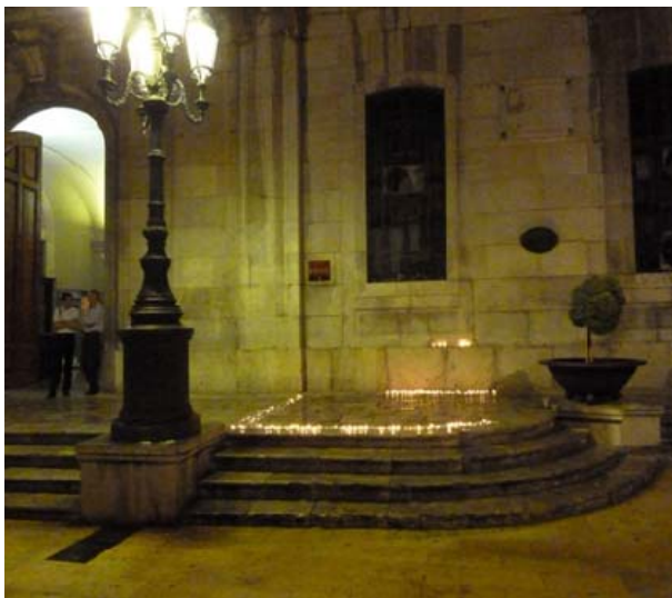
Moment en què les 365 espelmes estaven enceses a les escales de l'Ajuntament de Tarragona

"Les paraules són una medicina per a l'ànima que pateix", Esquillo