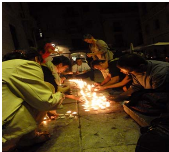
Moment de l'encesa de les espelmes, després de la lectura del manifest

"Les paraules són una medicina per a l'ànima que pateix". Esquilo