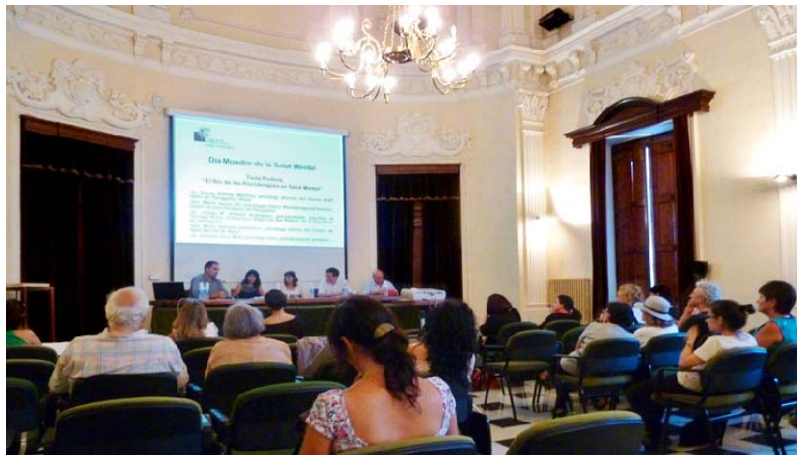
Moment de la presentació d'una de les ponències, a l'Ajuntament de Tarragona

Del conjunt de les cinc ponències es va derivar un plantejament comú: la idea que, independentment de l'àmbit d'actuació (públic, escolar, privat, etc), l'objecte de cada acte d'intervenció clínica és la salut d'aquelles persones que acudeixen a sol·licitar l'assessorament o l'ajuda dels serveis que s'ofereixen des de la psicologia. Parlar de psicologia, i en especial en l'àmbit clínic i de l'atenció sanitària, és parlar de diferents models teòrics i metodològics que obeeixen a perspectives singulars sobre la persona i el seu desenvolupament individual i social. Però encara que es puguin descriure diferències entre models, teories i escoles, es persegueix un mateix objectiu, el treball sobre la persona, la