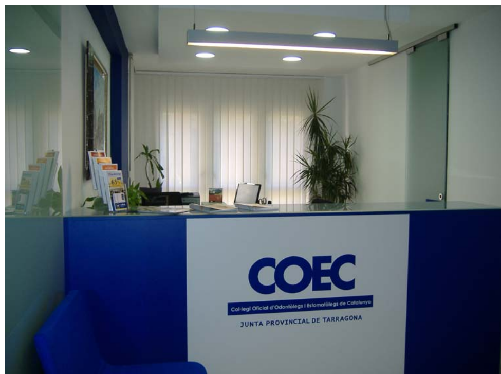
Recepció del col·legi Oficial d'Odontòlegs i Estomatòlegs de Catalunya Junta Provincial de Tarragona

"Les paraules són una medicina per a l'ànima que pateix". Esquilo