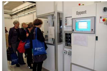
Moment de la visita a l'Hospital

Concretament, han visitat l'àrea quirúrgica, Radiologia, Urgències, Hospitalització i àrees tècniques com Farmàcia o la sala de comandament del sistema de transport robotitzat.