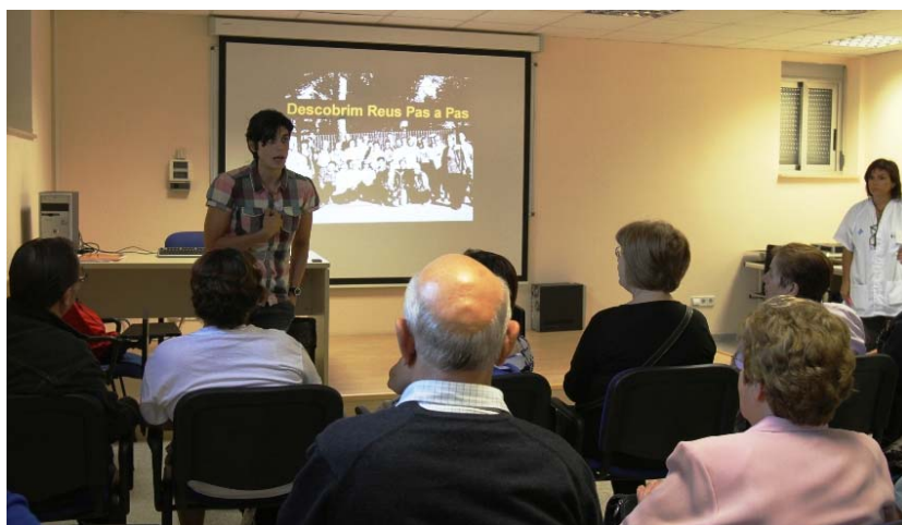
Moment de la presentació del programa de salut Pas a pas en un CAP de Reus

"Les paraules són una medicina per a l'ànima que pateix". Esquillo