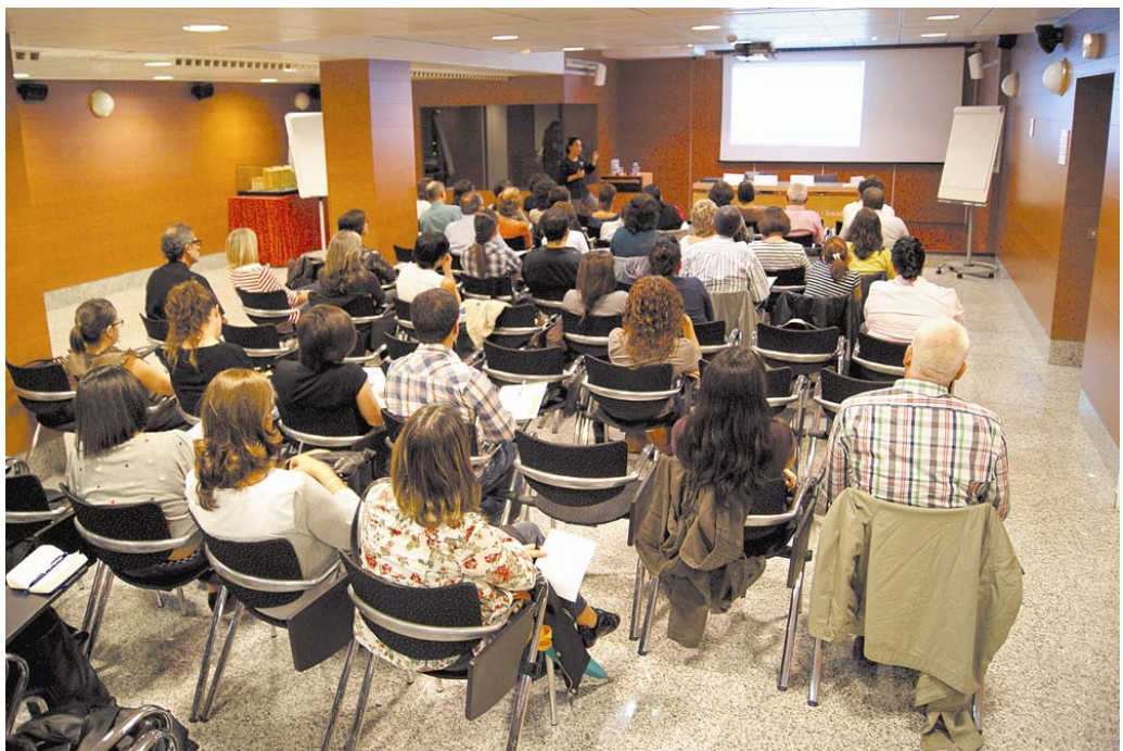
Moment de la jornada que va reunir pediatres d'atenció primària i hospitalària, a l'Hospital de Santa Tecla

Les jornades han constatat de sis sessions, repartides entre el matí i la tarda, amb ponents procedents de l'Hospital de la Vall d'Hebron de Barcelona, del Germans Trias i Pujol de Badalona, del Sant Joan de Reus, del Joan XXIII de Tarragona, de l'Hospital de Santa Tecla, i de d'atenció primària de la mateixa Xarxa Sanitària i Social de Santa Tecla.