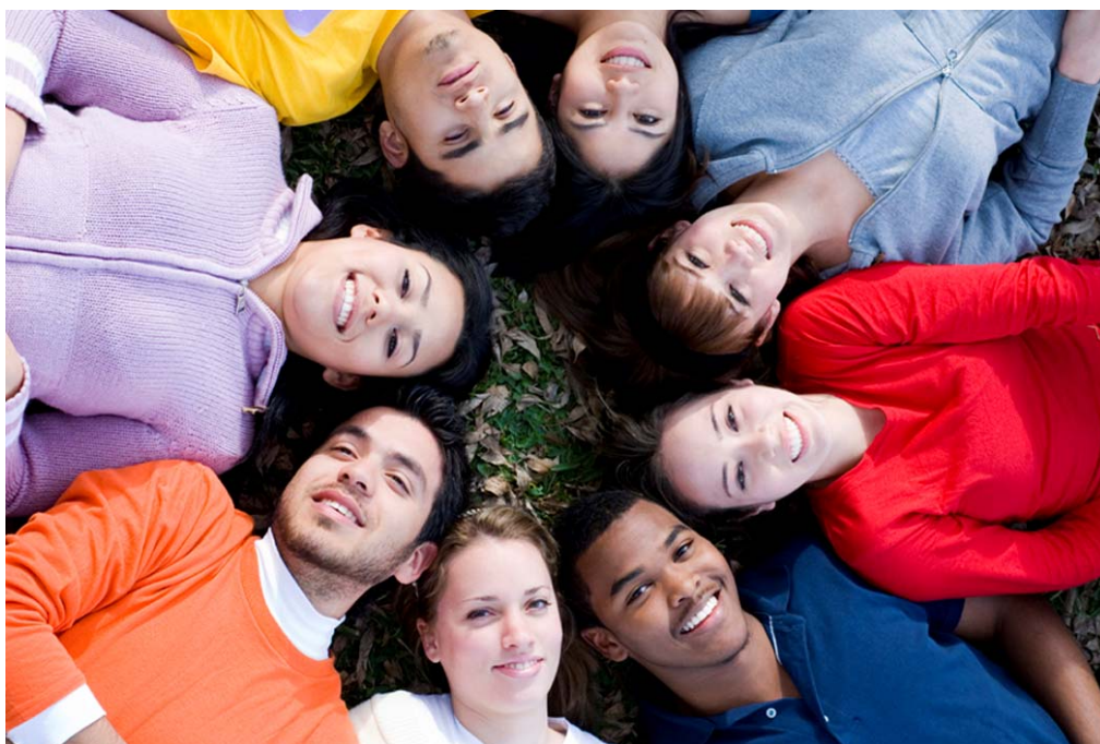
L'Equip d'Intervenció Precoç de l'Institut Pere Mata detecta la psicosi entre els joves d'entre 18 i 35 anys.

Quan sense una causa aparent es comencen a donar alguns d'aquests senyals d'alarma es pot estar gestant una psicosi, i és recomanable consultar l'especialista. Cal tenir en compte també que en l'evolució de la malaltia poden aparèixer períodes crítics amb l'aparició d'allucinacions, pensaments delirants i altres alteracions del pensament i de l'afectivitat.