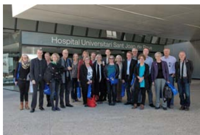
El grup de professionals danesos

deriksberg, situats a uns 3 km de distància l'un de l'altre. La delegació visita hospitals de tot el món per a documentar-se i aplicar les solucions més eficients.