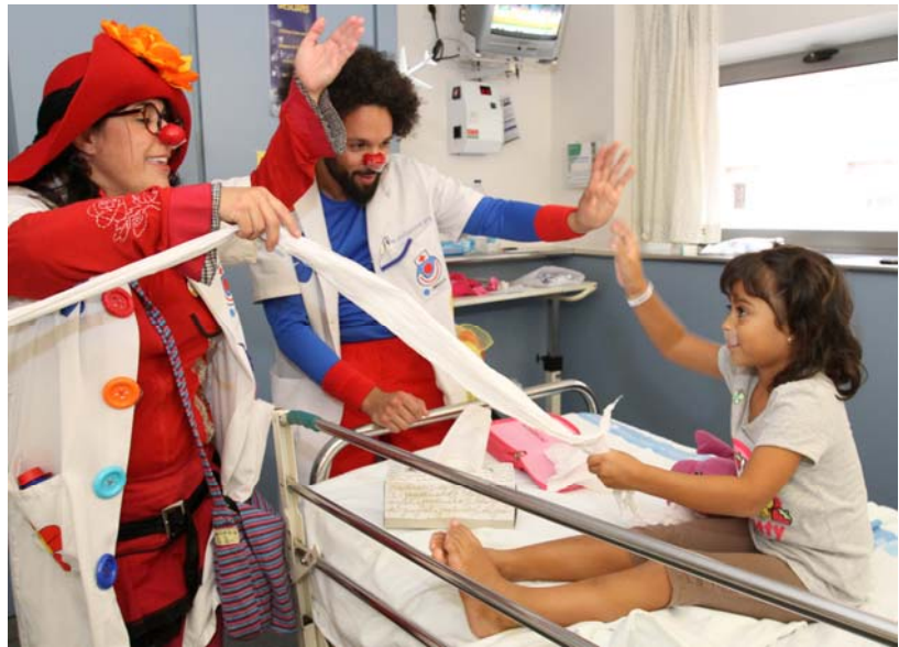
Moment en què integrants de l'ONG Pallapupas interaccionen amb una nena ingressada a la planta de Pediatria de l'Hospital Universitari Joan XXIII

"Les paraules són una medicina per a l'ànima que pateix". Esquilo