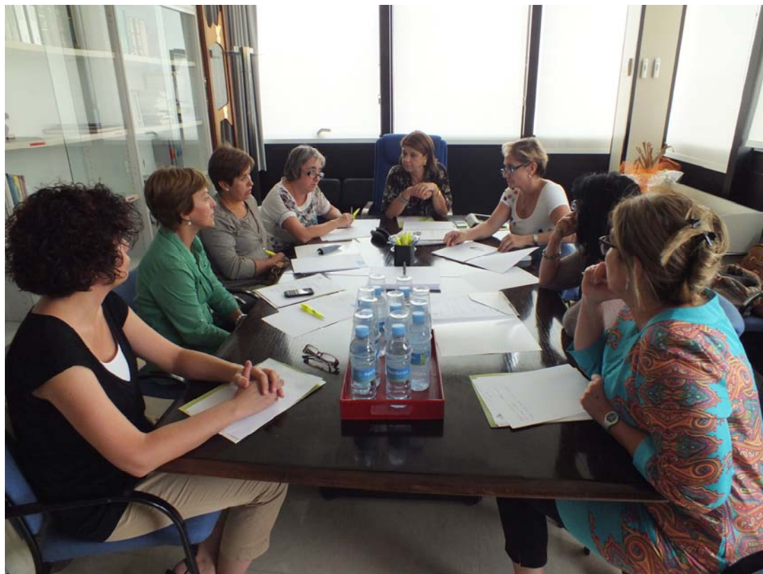
Reunió trimestral de directores d'Infermeria de la demarcació

"Les paraules són una medicina per a l'ànima que pateix". Esquillo