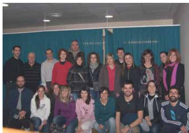
Els assistents al Curs Bàsic d'embenat neuromuscular.

Aquest és el primer acte formatiu del Col·legi de Fisioterapeutes de Catalunya promogut pel Grup d'Interès del Vallès Oriental.