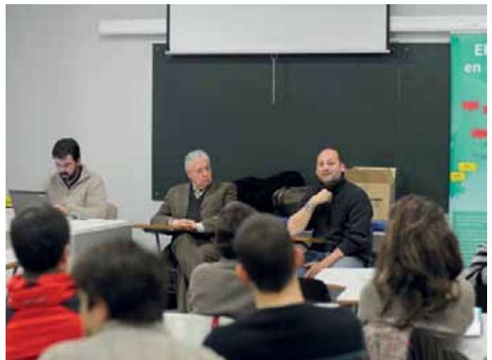
Los integrantes de la Junta de Gobierno se reunieron en la FUB con colegiados del Bages.

La reunión terminó pasadas las 22.00 h, con la sensación por parte de todos los asistentes, de haber podido compartir un rato de debate en el cual la Fisioterapia y su práctica en la comarca del Bages centraron la reunión.