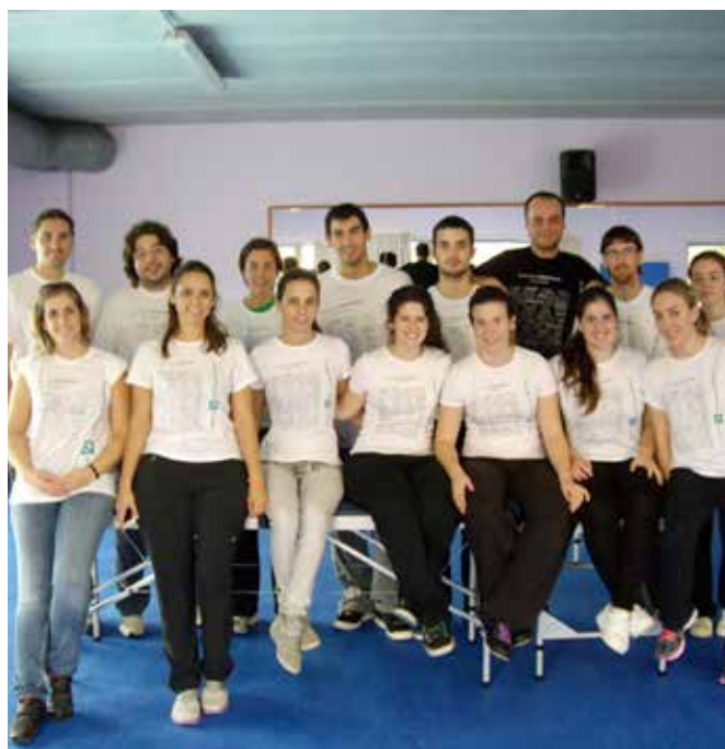
Estudiantes de Fisioterapia y fisioterapeutas colaboraron, en nombre del CFC, en la Media Maratón de Tarragona.

En relación a la masoterapia, mencionar que se ofrecía básicamente descarga en las extremidades inferiores, pero