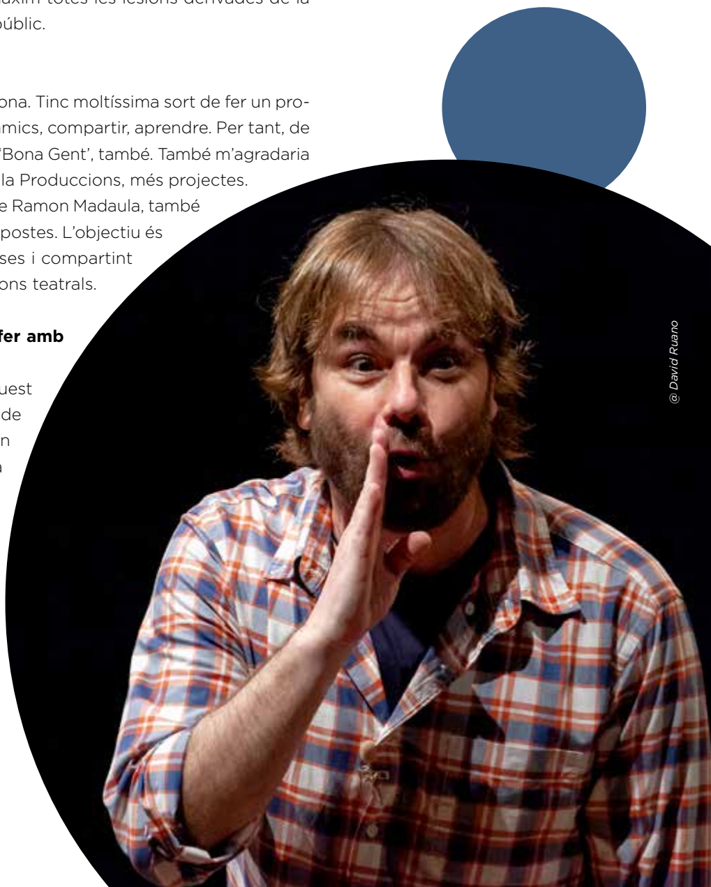
@ David Ruano

Passar molt de temps amb la meva filla. Aquest any tenim un estiu més tranquil i em ve molt de gust compartir amb ella molts moments. Un altre cop la paraula compartir. I aprendre! La meva filla té 8 anys i ella està en un procés d'aprendre, però les coses que aprenc jo d'ella!