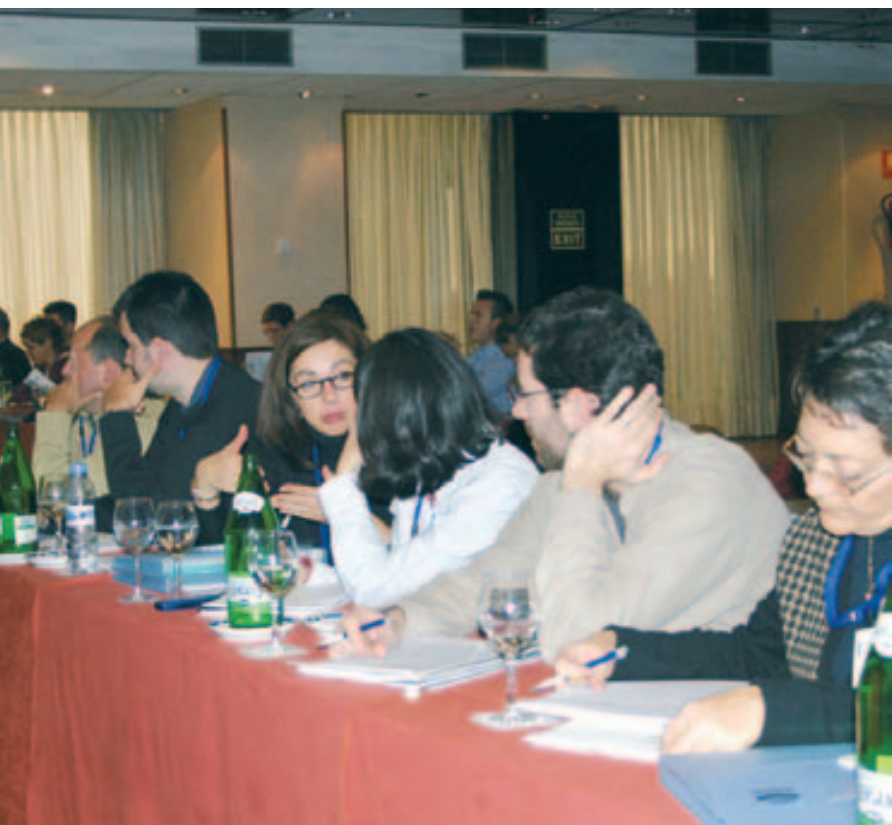
La delegació del Col·legi de Fisioterapeutes de Catalunya, en un moment de la jornada