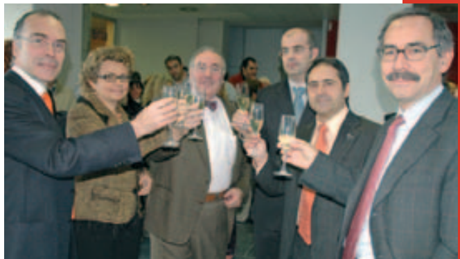
La consellera Marina Geli, en un moment de la inauguració de l'escola

El servei de hidroteràpia consta d'una piscina terapèutica, d'hidromassatge, dutxes de "vichy", escocesa, sauna humida (bany turc) pediluvi i maniluvi, on l'alumne realitza una formació teòrica i pràctica.