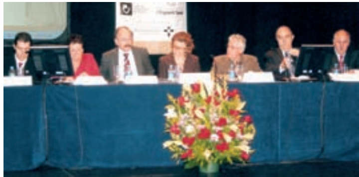
Un moment de les jornades celebrades en Santa Coloma