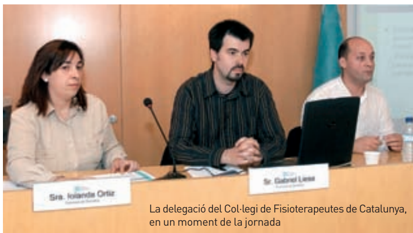
La delegació del Col·legi de Fisioterapeutes de Catalunya, en un moment de la jornada

La conferència va ser el primer dels actes d'una campanya divulgativa amb la qual la comissió vol assentar les bases de l'exercici professional. Així, a més de la reunió mantinguda amb altres professionals del Col·legi, estan previstes rondes de contacte amb l'Administració Pública, centres privats i amb els responsables universitaris. També elaboraran manuals d'ús per a fisioterapeutes amb plantejaments pràctics i reals