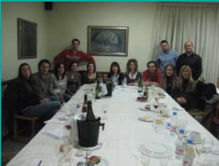
Els fisioterapeutes del Penedès i el Garraf durant el sopar de trobada al Restaurant El Trull de Vilafranca del Penedès

L'intercanvi d'experiències i el contrast d'opinions va resultar molt interessant per als presents, que van posar el punt de mira en la possibilitat futura d'organitzar xerrades, conferències o cursos a Vilafranca del Penedès destinats als fisioterapeutes de la zona.