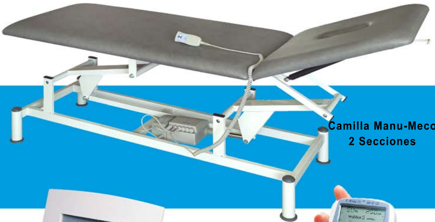
Camilla Manu-Meco 2 Secciones