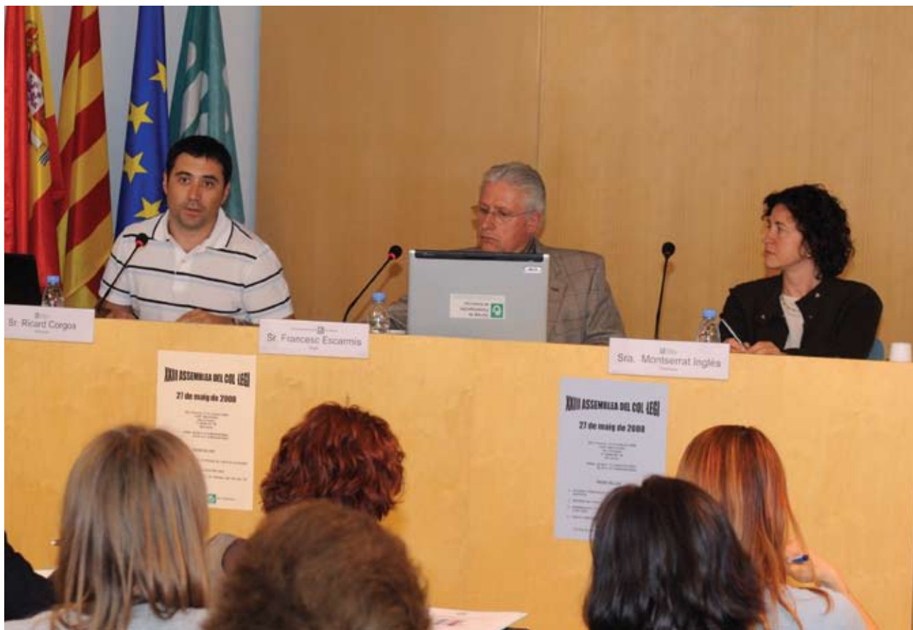
Els representants del Col·legi, durant l'Assemblea

El passat 27 de maig de 2008, tal i com marquen els estatuts del Col·legi de Fisioterapeutes de Catalunya, es va celebrar la XXIII Assemblea Ordinària que va servir per presentar la Memòria 2007 i per sotmetre a l'aprovació dels col·legiats el balanç econòmic del darrer any.