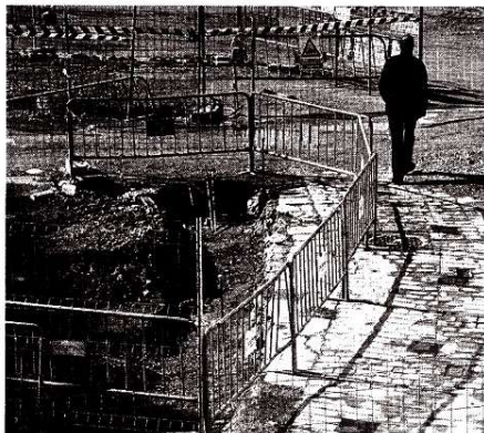
La construcción es uno de los sectores con más profesionales colegiados.