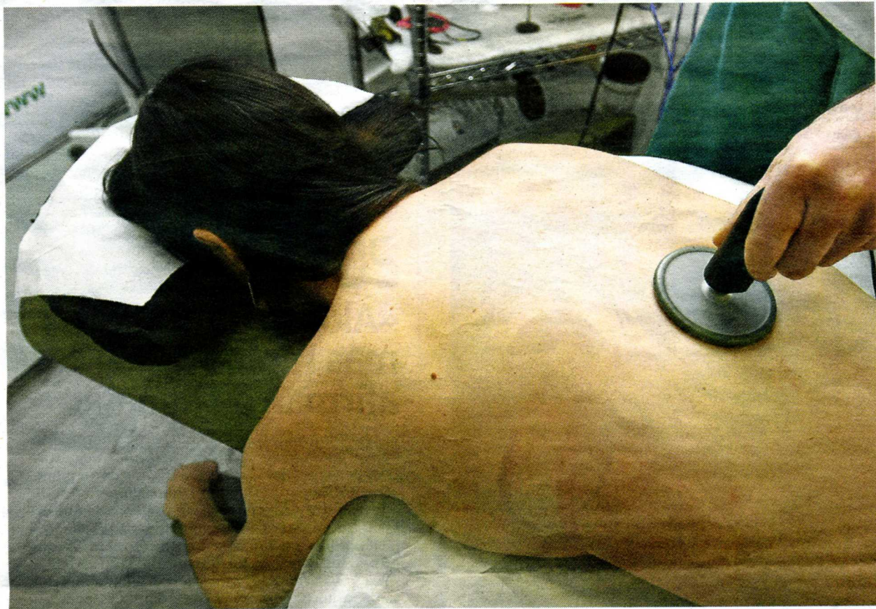
Una paciente, durante una sesión de Indiba en Fisioterapia Vicetto. Abajo, el equipo necesario para el tratamiento.

La hipertermia ha avanzado mucho desde los tiempos de Hipócrates y se utiliza para tratar esguinces, contracturas, lesiones deportivas, dolores de espalda, de cuello, articulaciones... Una de las técnicas más utilizadas es el Indiba. ¿En qué consiste? Intensifica la actividad celular, actúa a modo de vasodilatador incrementando la circulación sanguínea y linfática. Los masajes con Indiba estimulan la producción de oxígeno y contribuyen a la expulsión de radicales libres (las células que nos hacen envejecer).