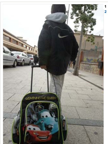
El mal de cap, de panxa, d'ossos i d'articulacions és el més freqüent entre els infants.

Passa de la mateixa manera amb les proporcions sobre la fibromiàlgia, que el doctor Carbonell estableix entre el 2 i el 6% de la població infantil que té dolor crònic. Però el fet és que la fibromiàlgia infantil encara és més