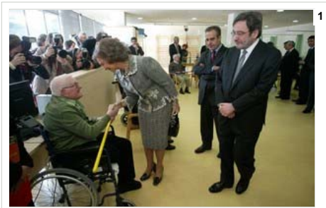
La reina Sofia, Narcís Serra i el ministre Celestino Corbacho parlen amb els pacients

Per afegir comentaris a qualsevol informació és necessari que us doneu d'alta en el registre d'Elpunt.cat . No s'admetran insults ni comentaris que vulnerin els drets i l'honorabilitat de les persones. Elpunt.cat es reserva el dret de no publicar els que vulnerin aquesta norma.