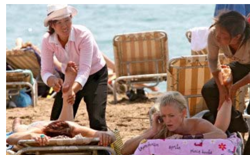
Imagen de archivo que muestra a dos masajistas asiáticas trabajando en la playa de la Barceloneta