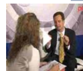
360º EN ONCOLOGÍA