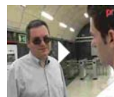
BRILLE, 6 PUNTOS QUE...