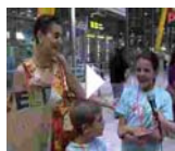
BIENVENIDA NIÑOS DE GHANA