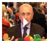
DECLARACIÓN C.G. ENFERMERÍA