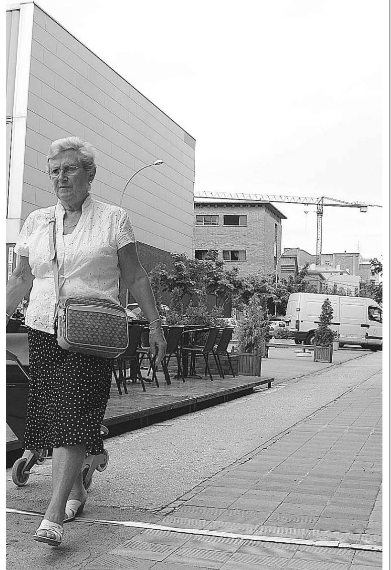
PLAÇA DEL SOL. Els marxants accepten parar en aquest indret

rà a construir el segon, al Passeig Nou. La previsió és que les obres comencin l'any vinent. Segons el calendari municipal, les obres no es podrien començar a licitar fins al 5 d'octubre. ■