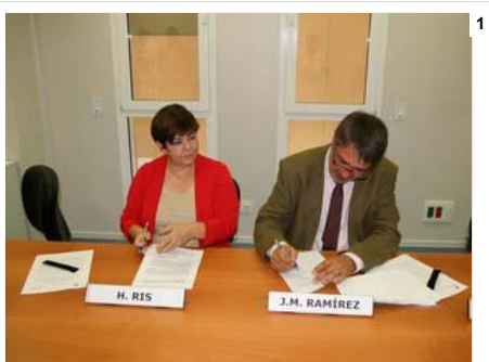
La signatura de l'acord entre el Parc Taulí i Guttmann.

Registrar-me. Per opinar sobre aquesta notícia cal estar registrat.