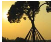
Tal com raja: el Pi d'en Xandri