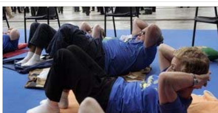
L'exercici moderat pot ajudar a combatre els efectes de l'osteoporosi

L'osteoporosi, o pèrdua de densitat mineral òssia, s'associa habitualment a les dones, sobretot a partir de la menopausa, però el cert és que es tracta d'una malaltia més freqüent en els homes del que sovint es pensa. De fet, un terç de totes les fractures de maluc –una de les conseqüències més habituals de l'osteoporosi– es produeixen en homes. Però si l'osteoporosi és poc coneguda entre el col·lectiu masculí, el que realment era desconegut fins ara és que aquesta malaltia té un origen diferent en homes i dones. Així ho han observat investigadors de l'hospital del Mar de Barcelona.