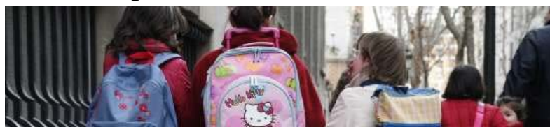
Un grupo de niñas con sus mochilas a cuestas. Ampliar foto

Conviene acomodar el peso de las mochilas a las características físicas del alumnado para evitar las lesiones musculares.