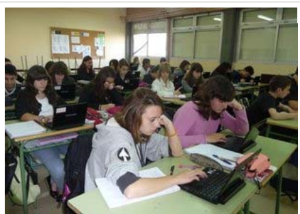
Alumnes de secundària treballen amb portàtils

Zapatero llança els ministres a col·laborar amb Montilla