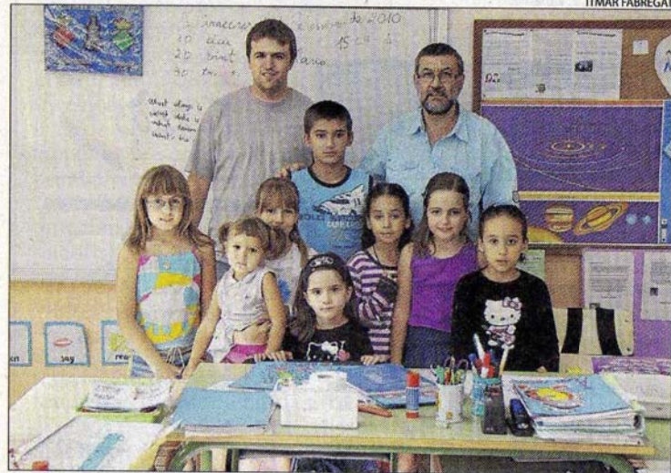
Escuela rural de Torre-serona con su tutor y otro profesor.

Un setenta por ciento de los jóvenes de entre 16 y 21 años sufren alguna dolencia de espalda y uno de cada diez niños menores de 10 años tiene ya algún achaque, según los datos del Colegio de Fisioterapeutas de Catalunya. Las causas son el exceso de peso en las mochilas, posturas inadecuadas en clase y demasiado tiempo ante el ordenador.