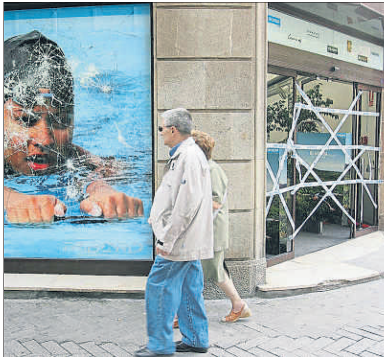
Una botiga Decathlon en una foto d'arxiu

Altres empreses encara estan tramitant les mesures. Ahir la patronal Faconauto va dir que "els