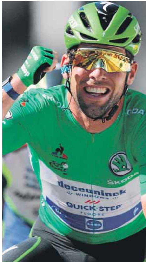
El manx, en assolir la gesta

La resta, quatre victòries en els quatre esprints que s'han disputat, per arribar a 34 en la tretzena etapa i just 13 anys després de la primera, ja són història. Com que el llançador danès Michael Mørköv –clau en les arribades de la bandada de llops– fos segon ahir. The wolf pack va passar per sota la pancarta dels últims 5 quilòmetres amb tres homes davant del mallot verd. Sonny Colbrelli i els Bahrain o Jasper Philipsen i els Alpecin buscaven el seu lloc. Fins i tot els DSM a 1,5 i l'asturià Iván García Cortina (Movistar) demostrant la classe que té, al fi-