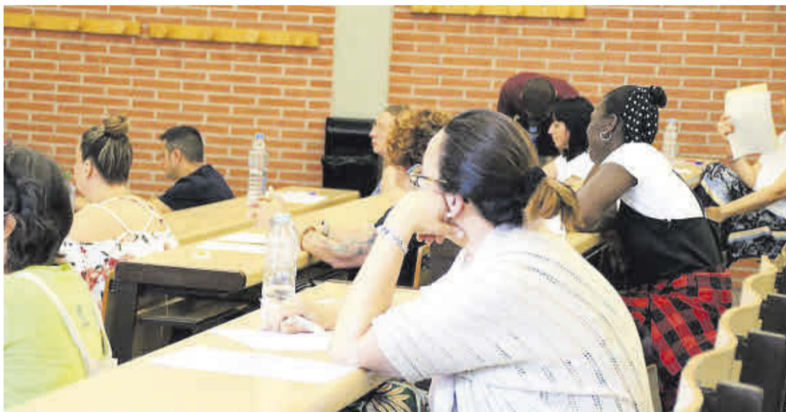
Diversos interins a punt de fer les oposicions al juliol.

► Tot i que s'hi van presentar més aspirants que places per cobrir, un 33% no va aprovar ► No són cadires buides, seguiran treballant com a interins