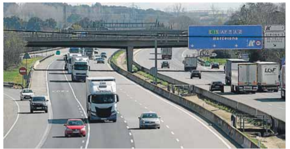
Vehicles circulant per l'AP-7