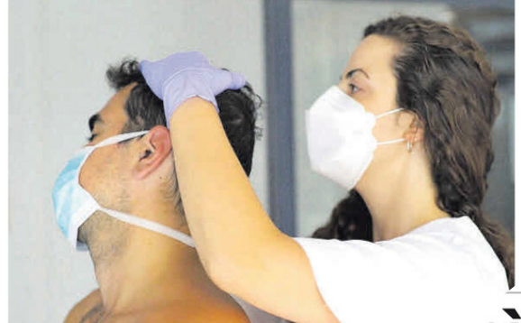
Una fisioterapeuta fent rehabilitació a un pacient.