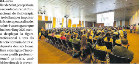
Fisioterapeutes en la Jornada Internacional d'Abril. COL·LEGI DE FISIOTERAPEUTES

Professionals gironins es mostren «esperançats» per la contractació de Salut aquest any