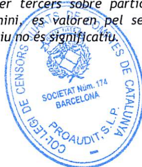
Ramon Aiguadé Aiguadé